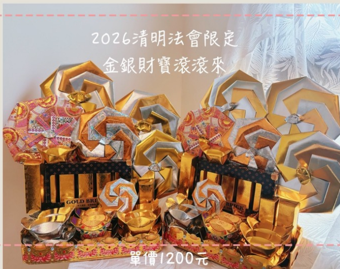
2026清明法會限定 金銀財寶滾滾來